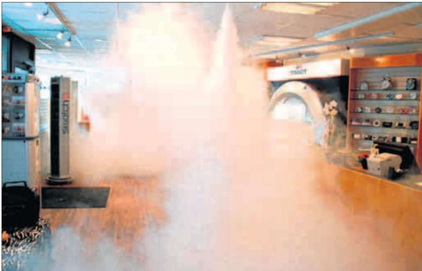
Siden starten i 2001 har Protect produceret og installeret over 30.000 anlæg med tågesikring over hele verden.